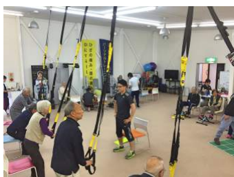
最新のトレーニングで