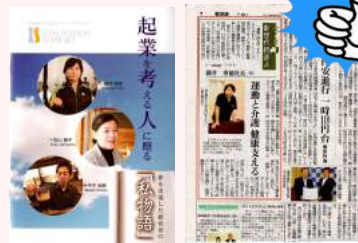
地元メディアも注目

運動を続け、旅行サークル・買い物サークル・ゴルフサークルを作ることでお客様がお客様を呼びます。