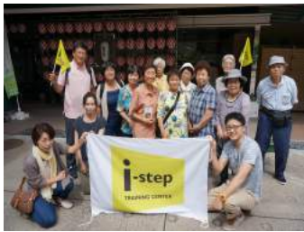
趣味・サークルを作り