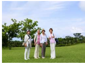
地域住民を元気にする