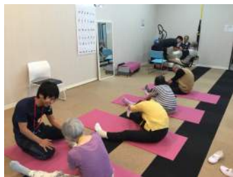
質と収益性を兼ねて